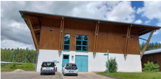
5 In 96524 Rottmar: Photovoltaik-/Trinkwasseraufbereitungsanlage Föritzer Straße