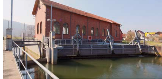
2 In 99830 Falken: Wasserkraftwerk Mühlstraße