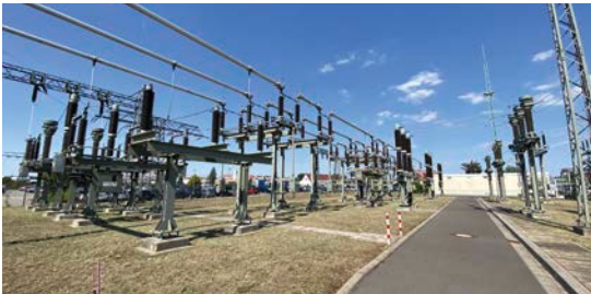
3 In 99734 Nordhausen: Umspannwerk Industrieweg