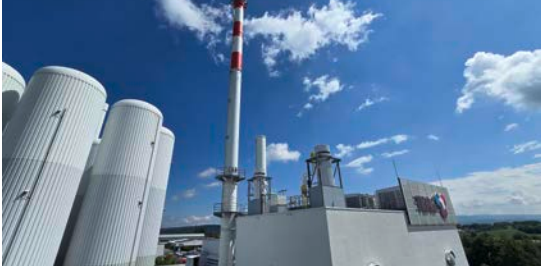
1 In 36433 Bad Salzungen: Heizkraftwerk Langenfelder Straße 82