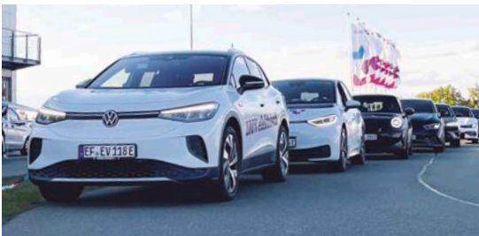
7 In 99428 Nohra: Elektromobilitätstag im ADAC-Fahr- sicherheitszentrum, Gebreitestraße 2