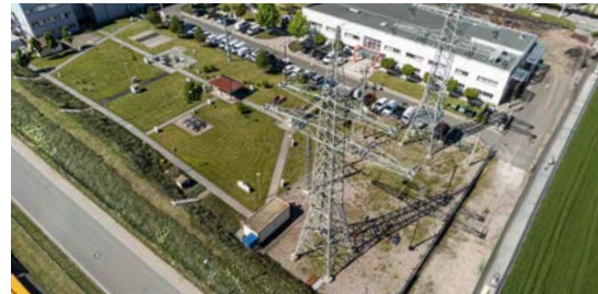
4 In 99087 Erfurt: TEAG Akademie/Ausbildungszentrum Schwerborner Straße 30