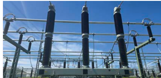
6 In 07368 Remptendorf: Umspannwerk Umspannwerkstraße